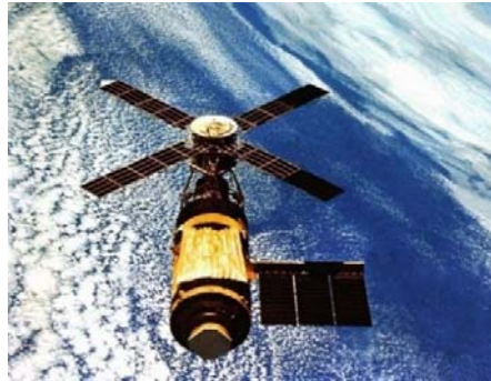
Figura 1.1: Ejemplo de imagen con resolución aceptable.

Las tablas deben estar numeradas en secuencia y por capítulo (numeración propia) y el nombre (Tabla 1.1: ...) debe aparecer en la parte superior de la tabla.